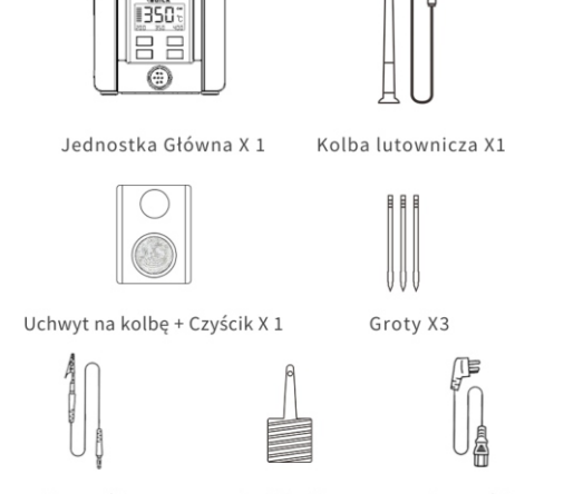
Jednostka Główna X 1