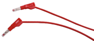
Nr kat. 105077