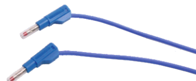
Nr kat. 105079