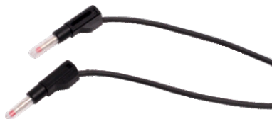
Nr kat. 105078